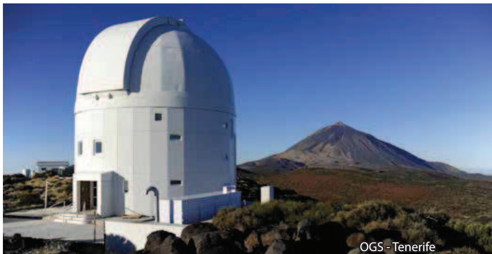
OGS - Tenerife

Jaké jsou důvody pro kosmický výzkum? V čem je tento způsob výhodný?