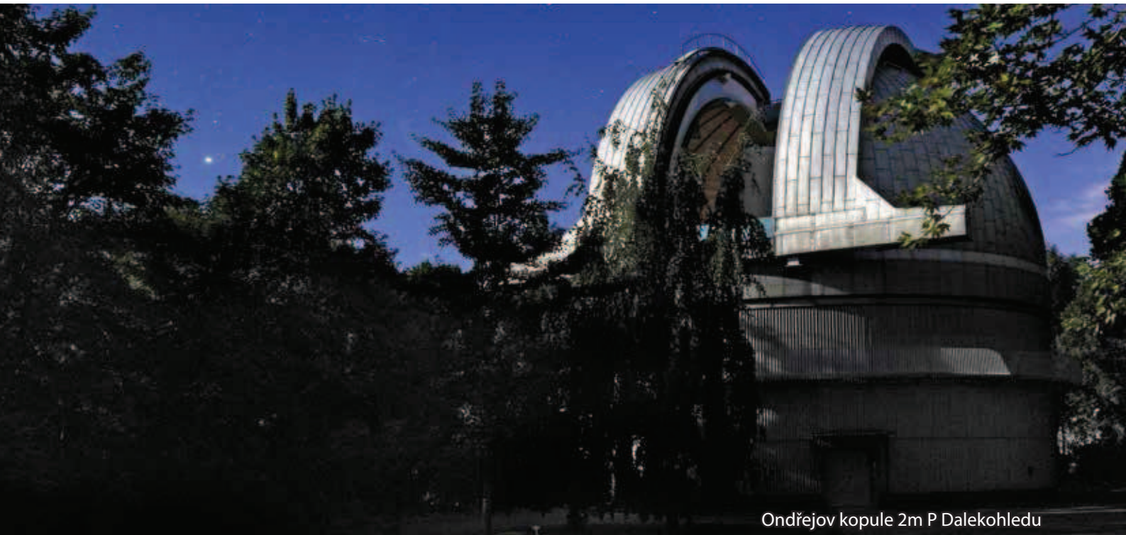
Ondřejov kopule 2m P Dalekohledu