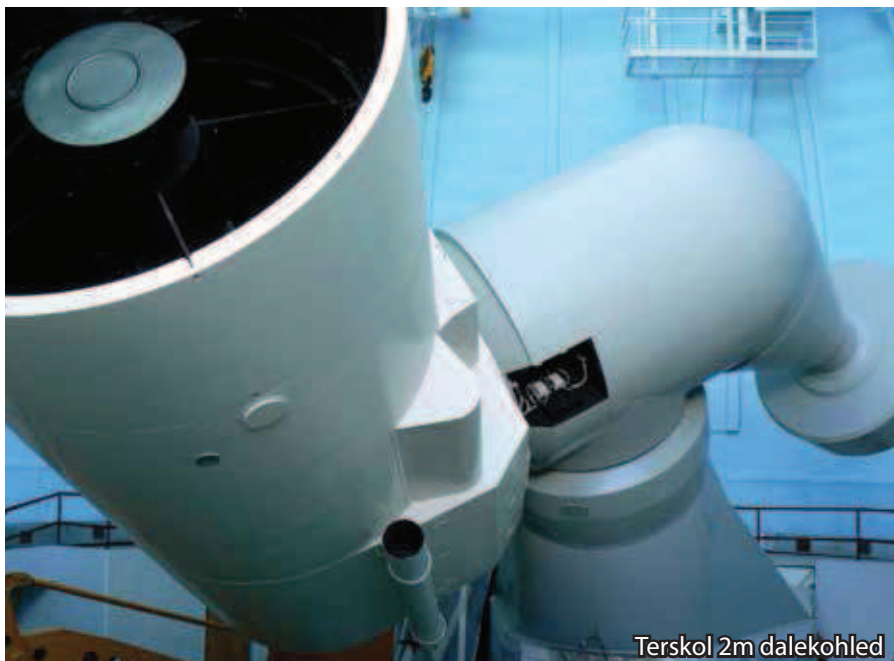
Terskol 2m dalekohled

stejně, jako tomu je i u průmyslových aplikací. Průmyslové řešení má tu výhodu, že podmínky observatoře nejsou tak extrémní, jako je tomu v průmyslu, kde okolní teplota mnohdy dosahuje až +50 °C a vlhkosti 100 % apod.