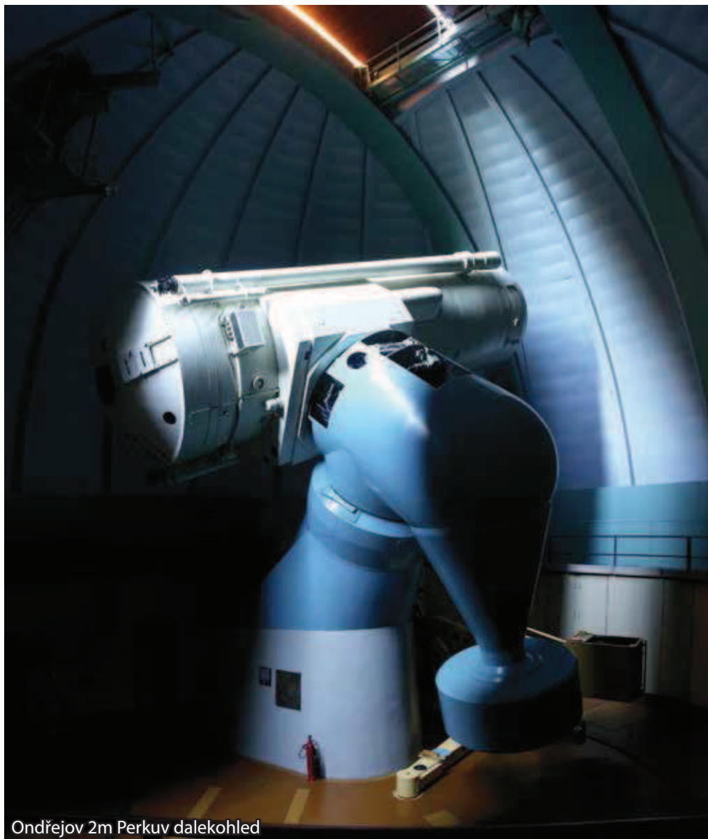
Ondřejov 2m Perkuv dalekohled

V případech, kdy není nutná osobní intervence, se většina servisních zásahů odehrává po vzdáleném přístupu prostřednictvím internetu. Na zakázku se vztahují standardně dva roky záruky